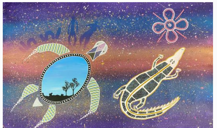
图片：2022年主题：复原。两个人一起走在走向和解和恢复彼此的旅程中。

去年，我们有一些令人惊叹的艺术品。这个项目给了人们一个独特的机会来展示他们特定的才能和技能，以回应我们的主题。